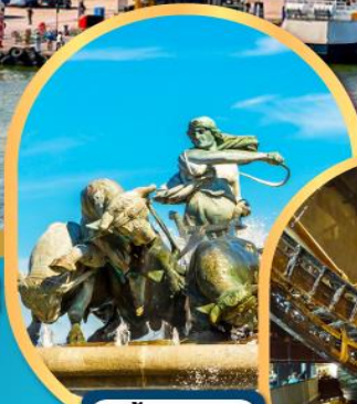
น้ำพุแห่ง ราชินีเทพีออน