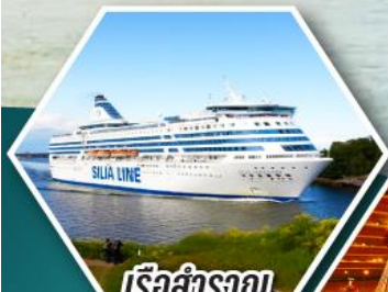
เรือสำราญ TALLINK SILJA LINE