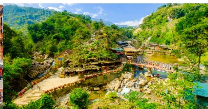
หมู่บ้านก๊อต ก๊อต

*ทางบริษัทฯ ขอสงวนสิทธิ์ในการสลับโปรแกรมทัวร์ตามความเหมาะสมขึ้นอยู่กับสถานการณ์ปัจจุบัน โดยคำนึงถึงผลประโยชน์ของลูกค้าเป็นสำคัญ