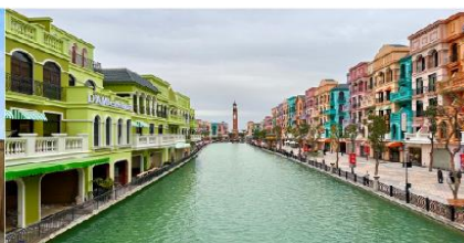
เมก้าแกรนด์เวิลด์ฮานอย