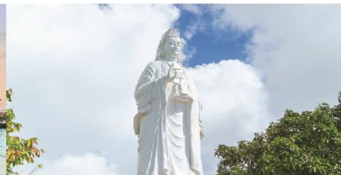
วัดลินห์ฮิ่ง

*ทางบริษัทฯ ขอสงวนสิทธิ์ในการสลับโปรแกรมทัวร์ตามความเหมาะสมขึ้นอยู่กับสถานการณ์หน้างาน โดยคำนึงถึงผลประโยชน์ของลูกค้าเป็นสำคัญ