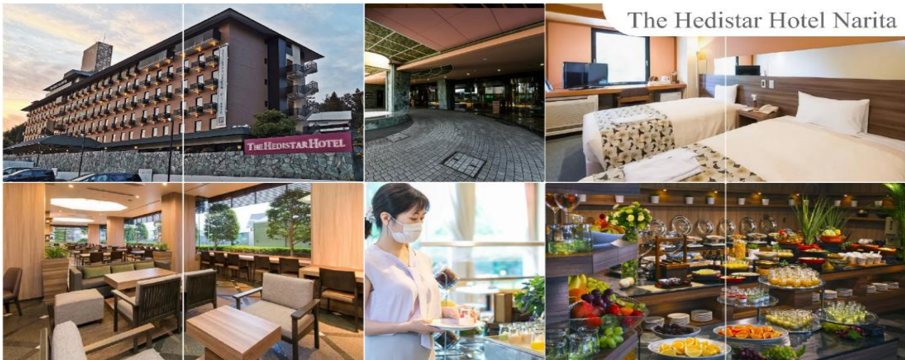
The Hedistar Hotel Narita

วันแรก ท่าอากาศยานนานาชาติดอนเมือง – ท่าอากาศยานนานาชาตินาริตะ – เมืองนาริตะ 08.30 น. พร้อมกันที่ ท่าอากาศยานนานาชาติ ดอนเมือง อาคาร 1 ผู้โดยสารชาวอกระหว่างประเทศ เคาน์เตอร์ สายการบินแอร์เอเชีย เล็กซ์ เจ้าหน้าที่ของบริษัทฯ คอยให้การต้อนรับ และอำนวยความสะดวกในการเช็คอิน 11.55 น. เที่ยงไฟสู่ ท่าอากาศยานนานาชาตินาริตะ เมืองนาริตะ ประเทศญี่ปุ่น โดยเที่ยวบินที่ XJ606 สายการบิน AIR ASIA X ใช้เครื่อง AIRBUS A330-300 จำนวน 377 ที่นั่ง จัดที่นั่งแบบ 3-3-3 (น้ำหนักกระเป๋า 20 กก./ท่าน หากต้องการซื้อน้ำหนักเพิ่ม ต้องเสียค่าใช้จ่าย) บริการอาหารและเครื่องดื่มบนเครื่อง(ราคาโปรโมชั่นไม่มีอาหารบนเครื่อง) 20.00 น. เดินทางถึง ท่าอากาศยานนานาชาตินาริตะ ประเทศญี่ปุ่น นำท่านผ่านขั้นตอนการตรวจคนเข้าเมืองและศุลกากร เรียบร้อยแล้ว (เวลาที่ญี่ปุ่น เร็วกว่าเมืองไทย 2 ชั่วโมง กรุณาปรับนาฬิกาของท่านเพื่อความสะดวกในการนัดหมายเวลา) ***สำคัญมาก!! ประเทศญี่ปุ่นไม่อนุญาตให้นำอาหารสด จำพวก เนื้อสัตว์ พืช ผัก ผลไม้ เข้าประเทศ หากฝ่าฝืนมีโทษปรับและจับ นำท่านสู่ เมืองนาริตะ (Narita) เมืองที่อยู่ห่างไปทางตะวันออกของกรุงโตเกียว 60 กิโลเมตร ตั้งอยู่ทางตอนเหนือของจังหวัดจิบะ มีแม่น้ำโทเนะกันแบ่งกับเมืองอึบารากิ มีพื้นที่ทั้งหมด 214 ตารางกิโลเมตร และประชากร 120,000 คนโดยประมาณ เมืองแห่งนี้อุดมสมบูรณ์ไปด้วยแหล่งน้ำและความเขียวขจีของต้นไม้ใหญ่ๆ นำท่านเข้าสู่ที่พัก (ใช้เวลาเดินทางประมาณ 15 - 20 นาที) (โดยรถบัสโรงแรม) พักที่ THE HEDISTAR HOTEL NARITA หรือระดับเดียวกัน