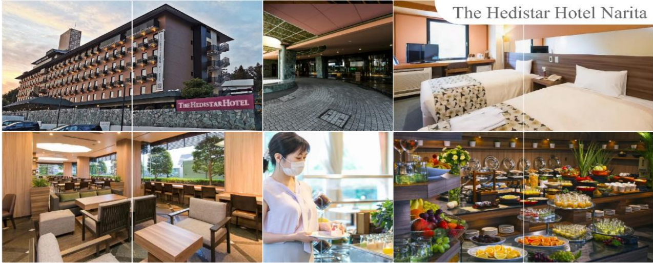
The Hedistar Hotel Narita

THE HEDISTAR HOTEL NARITA หรือระดับเดียวกัน