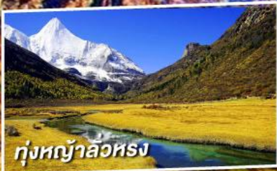
ทุ่งหญ้าลั่วหรง