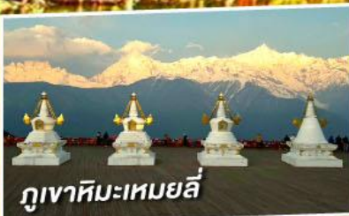
ภูเขาหิมะเหมยลี่