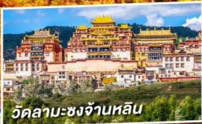
วัดลามะชงจ้านหลิน