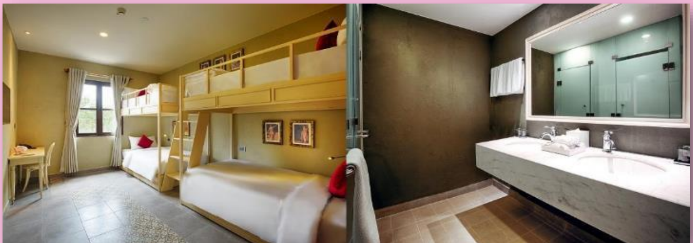
GO1DAD-VZ109 GO VIETNAM ดานัง เวียดนาม เมืองแห่ง มรดกโลก ฮอยอัน บานาฮิลล์ 4 วัน 3คืน โดยสายการบิน VietJet Air (VZ)

*ห้องพักบนบานาฮิลล์ สำหรับพักเข้าพัก 3 ท่าน FAMILY BUNKS 1 ห้องพัก ( ประกอบด้วย เตียง 2 ชั้น จำนวน 2 เตียง )