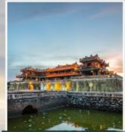
เว้ พระราชวังไถ่ไญ่