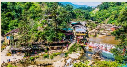
หมู่บ้าน Cat Cat