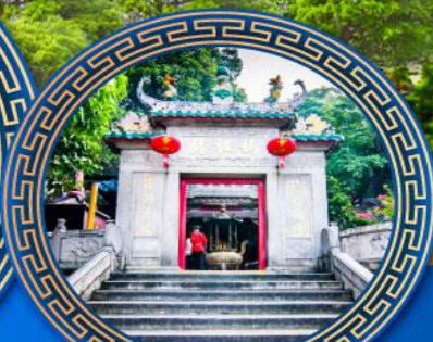
วัดอาม่า มาเก๊า