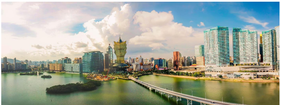
GO1MFM-NX007 มาเก๊า อ่องกง ไห่พระ นังกระเช้าฮองปิง เวเนเซียน 4 วัน 3 คืน โดยสายการบิน Air Macau (NX) พัก 5 คืน

21.50 น. เดินทางถึง สนามบินสุวรรณภูมิ โดยสวัสดิภาพ พร้อมความประทับใจ