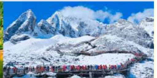
ภูเขาหิมะมิงกรหยก

*ทางบริษัทฯ ขอสงวนสิทธิ์ในการสลับโปรแกรมทัวร์ตามความเหมาะสมขึ้นอยู่กับสถานการณ์ปัจจุบัน โดยคำนึงถึงผลประโยชน์ของลูกค้าเป็นสำคัญ