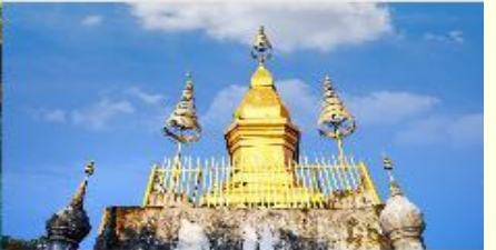
พระธาตุพูสี

*ทางบริษัทฯ ขอสงวนสิทธิ์ในการสลับโปรแกรมทัวร์ตามความเหมาะสมขึ้นอยู่กับสถานการณ์หน้างาน โดยคำนึงถึงผลประโยชน์ของลูกค้าเป็นสำคัญ