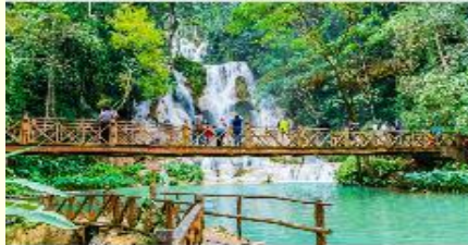
น้ำตกตาดกวางสี