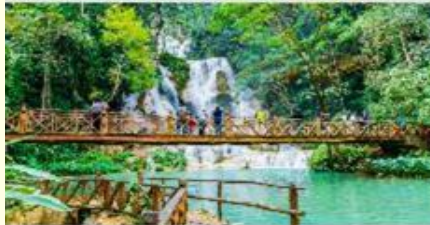
น้ำตกตาดกวาสี