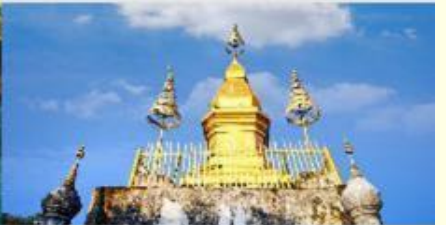
พระธาตุพูสี

*ทางบริษัทฯ ขอสงวนสิทธิ์ในการสลับโปรแกรมทัวร์ตามความเหมาะสมขึ้นอยู่กับสถานการณ์หน้างาน โดยคำนึงถึงผลประโยชน์ของลูกค้าเป็นสำคัญ