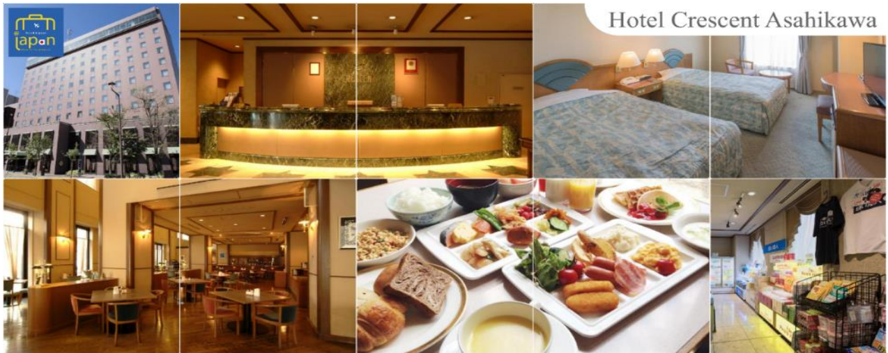
Hotel Crescent Asahikawa

คำ อีสระรับประทานอาหารค่ำตามอัธยาศัย ที่พัก HOTEL CRESCENT ASAHIKAWA หรือเทียบเท่าระดับเดียวกัน