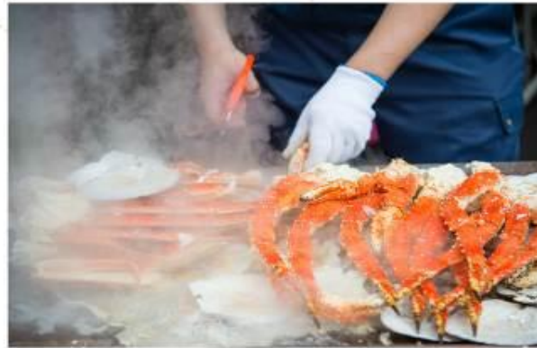
อีแอส-อาหารกลางวันตามอีแอสทึย (รับเงินจากบัตรเครดิต ค่าโต๊ะ 3,000 เยน)

อีแอส-ช้อปปิ้ง "อีออนมอลล์นารัต" เป็นศูนย์การค้าขนาดใหญ่ที่ตอบโจทย์ทุกความต้องการของคุณ เต็มไปด้วยร้านค้ากว่า 150 ร้าน คัดสรรสินค้าหลากหลายประเภท ไม่ว่าจะเป็นเสื้อผ้าแฟชั่น เครื่องสำอางค์ ของใช้ในบ้าน อาหารสด อุปกรณ์อิเล็กทรอนิกส์ ของฝาก และอื่นๆ อีกมากมาย สินค้าแบรนด์ดังมากมาย ซูเปอร์มาร์เก็ตขนาดใหญ่ให้คุณได้เลือกซื้อขนม ของใช้ และสินค้าทั่วไปก่อนเดินทางกลับ