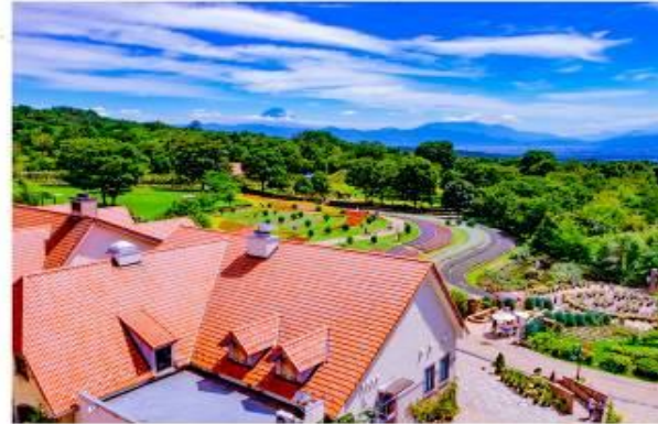
รับประทานอาหารกลางวัน ณ กิตติาคาร