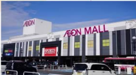
07: รูปภาพประกอบวิดีโอการโฆษณาเท่านั้น

เดินทางสู่ "สนามบินนานาชาตินารัต" เป็นสถานที่ที่นักท่องเที่ยวส่วนใหญ่จะได้สัมผัสเป็นที่แรกหลังจากมาถึงญี่ปุ่น ที่มีเป็นสนามบินที่ทันสมัย สะดวกสบาย และได้รับการออกแบบมาเป็นอย่างดี รวมถึงมีอะไรให้ดูและทำมากมาย อาคารผู้โดยสารหลักสองแห่งมีทั้งร้านค้า ร้านอาหาร พื้นที่นั่งรอสุดผ่อนคลาย หอขบวนตัวกัน และกิจกรรมต่างๆ ที่จะทำให้คุณเพลิดเพลินอยู่ตลอด