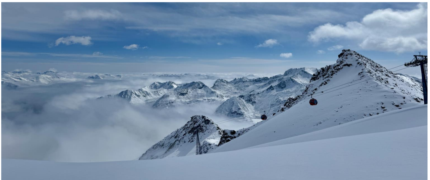
GO1TFU-TG011 เฉิงตู ภูเขาหิมะกลาเซียร์ต้ากู่ปังชว่น โหมวหนี่โกว จี้จ้ายโกว(นั่งรถไฟความเร็วสูง) 6วัน 5คืน *ไม่ลงร้านช้อปปิ้ง/รวมรถเหมา* โดยสายการบิน Thai Airway (TG)

เช้า รับประทานอาหารเช้า ณ ห้องอาหารภายในโรงแรม (มื้อที่ 2)