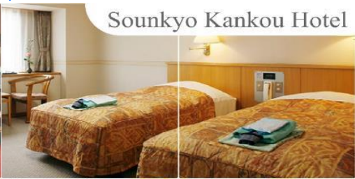
Sounkyo Kankou Hotel