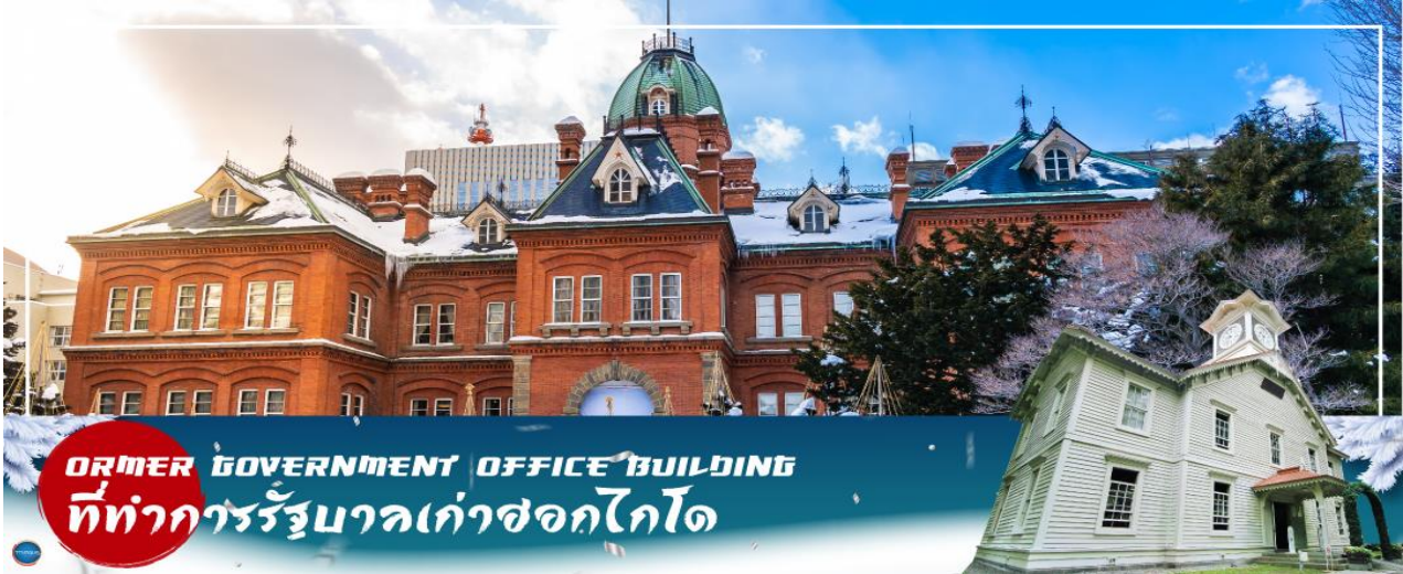
FORMER GOVERNMENT OFFICE BUILDING ที่ทำการรัฐบาลเก่าซอกไกโด

วันที่สาม เมืองซัปโปโร – ดิวตี้ฟรี – ผ่านชม ศาลาว่าการเมืองซอกไกโดหลังเก่า – ผ่านชม หอนาฬิกาเมืองซัปโปโร – เมืองอาซาฮิคาว่า – โซนเดียว – ภูเขาคุโรดากะ (นั่งกระเช้า)**ขึ้นอยู่กับสภาพอากาศ** – ออนเซน