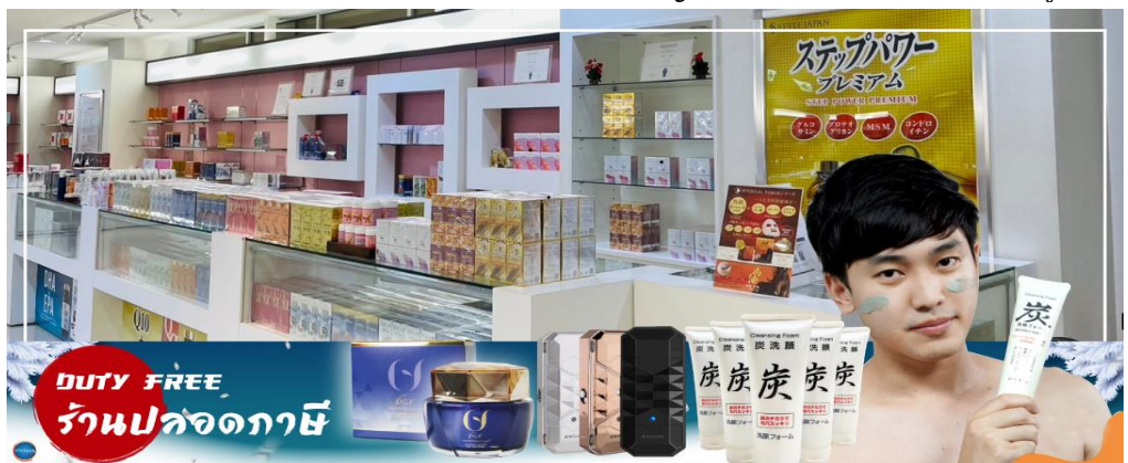
DUTY FREE ร้านปลอดภาษี

จากนั้นเดินทางสู่ เมืองอาซาฮิคาว่า (Asahikawa) (ใช้เวลาเดินทางประมาณ 2.30 ชั่วโมง) เป็นเมืองใหญ่อันดับ 2 ของจังหวัดซอกไกโด รองจากเมืองซัปโปโร เป็นเมืองศูนย์กลางทางตอนเหนือของเกาะ ล้อมรอบด้วยเทือกเขาไดเซตสึชันและแม่น้ำน้อยใหญ่ มีแหล่งท่องเที่ยวยอดนิยมอยู่หลายแห่ง