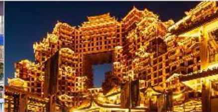
ตึกมหิศวรรษย์ 72 ชั้น

*ทางบริษัทฯ ขอสงวนสิทธิ์ในการสืบโปรแกรมทัวร์ตามความเหมาะสมขึ้นอยู่กับสถานการณ์ปัจจุบัน โดยคำนึงถึงผลประโยชน์ของลูกค้าเป็นสำคัญ