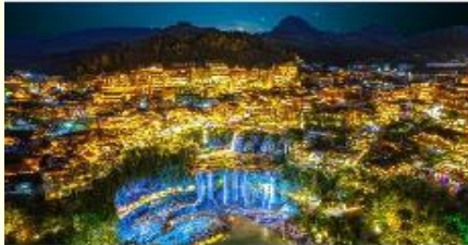
ฝูหลงเจิ้น