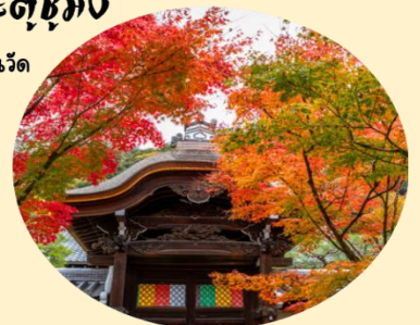
จุดประตูชุงมง เป็นประตูด้านใน บริเวณด้านในวัด