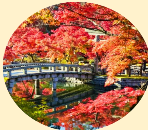
จุดร้านน้ำชา และถนนญี่ปุ่น ที่ให้ภาพบรรยากาศที่งดงามของลานหนึ่งสีแดง ที่ปกคลุมไปด้วยใบไม้เปลี่ยนสี

บ่อน้ำที่อยู่ใจกลางวัด มีสะพานข้ามมายังศาลเจ้าถือเป็นจุดถ่ายภาพยอดนิยม