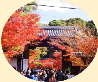
จุดประตูโชมง เป็นประตูทางเข้าหลักของวัดเอคันโด

นำท่านเยี่ยมชม วัดเอคันโด หรือที่รู้จักกันอีก 3 ชื่อ อาทิ เซนรินจิ โชจูโรโจเซซัง และมุเรียวจูอิน วัดแห่งนี้ตั้งอยู่ทางฝั่งใต้ของ ทางเดินนักปราชญ์ (Philosopher's Path) ตรงใจกลางเมืองอิงาชิยามะ พื้นที่ตรงนี้กว้างใหญ่โดยมีอาคารมากมายที่เชื่อมถึงกันด้วยทางเดินแบบมีหลังคาคลุม วัดแห่งนี้คือของขวัญที่ขุนนางตุลาการในสมัยเออัน (ปี 794-1185) มอบให้พระสงฆ์ ภายในวัดเต็มไปด้วยงานศิลปะหลากหลายชิ้น โดยชิ้นที่มีชื่อเสียงที่สุดคือรูปปั้นพระอมิตาพุทธ ซึ่งพระเศียรหันไปด้านหนึ่งแทนที่จะมองตรงมาทางด้านหน้าอย่างที่เห็นกันตามปกติ ตำนานเล่าไว้ว่าขณะที่เจ้าอาวาสประกอบพิธีสำหรับพระพุทธรูปองค์นี้ ท่านได้เห็นมามองและพูดคุยกับเจ้าอาวาส อีกทั้งยังเป็นวัดที่รู้จักกันดีว่ามีใบไม้ที่สวยงามมีชื่อเสียงในการชมใบไม้เปลี่ยนสีในช่วงฤดูใบร่วงตอนประมาณปลายเดือนพฤศจิกายนถึงต้นเดือนธันวาคม โดยจะงดงามมากขึ้นไปอีกจากแสงที่มาจากกระทบบายเย็นภายในวัดมีมุมถ่ายภาพกับใบไม้เปลี่ยนสีมากมาย อาทิ