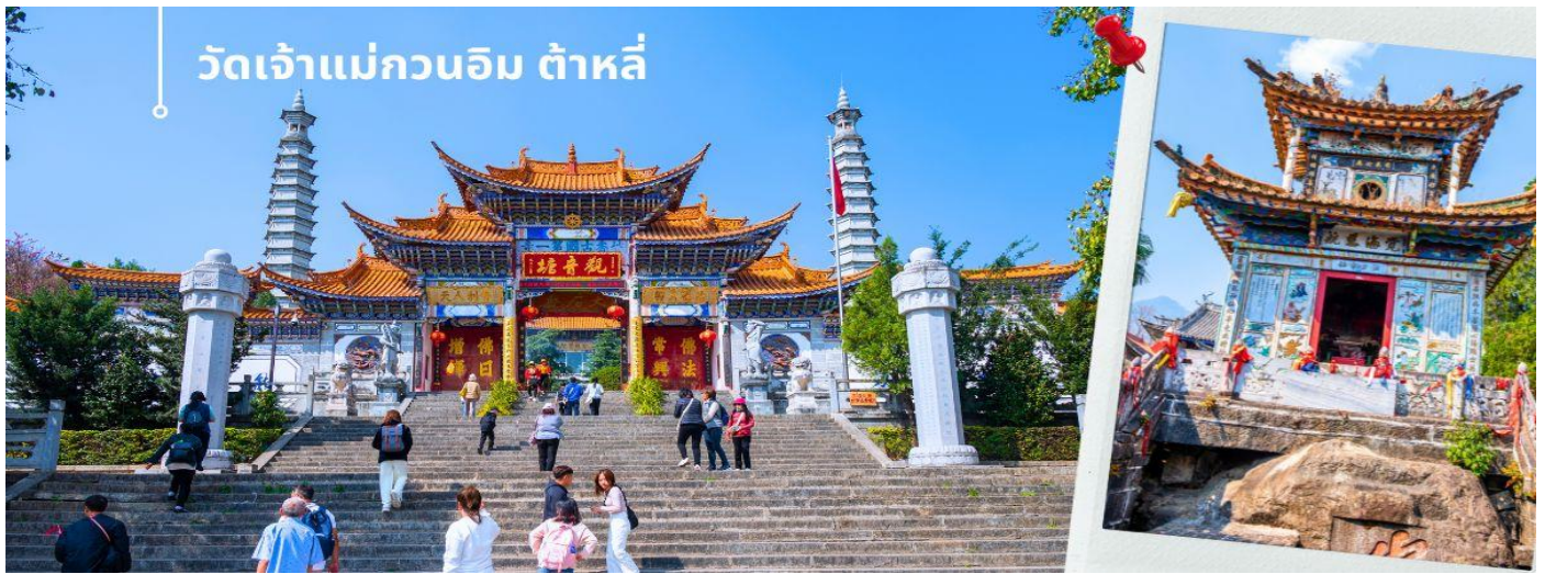
วัดเจ้าแม่กวนอิม ต้าหลี่

เช้า 🕒 รับประทานอาหารเช้า ณ ห้องอาหารโรงแรม (4) นำท่านชม วัดเจ้าแม่กวนอิม (ใช้เวลาเดินทาง 30 นาที) ตามตำนานเล่าว่าเจ้าแม่กวนอิมได้แปลงกายเป็นหญิงชราแบกก้อนหินใหญ่ไว้บนหลังเพื่อให้ทหารของฝ่ายตรงข้ามได้เห็นเมื่อทหารฝ่ายศัตรูได้เห็นว่ามีแม่แต่หญิงชรายังแข็งแรงถึงเพียงนี้ ถ้าเป็นคนวัยหนุ่มสาวจะต้องมีพลังกำลังมากมายยากที่จะต่อสู้อ จึงทำให้ไม่ทำการเข้าโจมตีเมืองและถอยทัพกลับไป ชาวเมืองจึงสร้างวัดแห่งนี้ขึ้นในสมัยราชวงศ์ถัง ซึ่งถือว่าเป็นวัดที่มีประติมากรรมยอดเยี่ยมแห่งหนึ่งในต้าหลี่