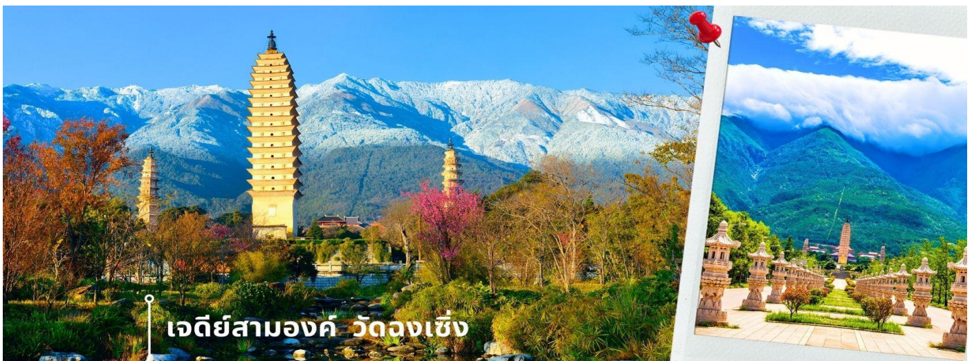
เจดีย์สามองค์ วัดจงเซ็ง

จากนั้นผ่านชม เจดีย์สามองค์ สัญลักษณ์ของเมืองต้าหลี่ ตั้งอยู่ภายใน วัดจงเซ็ง (Chongsheng Temple) วัดเก่าแก่ที่สร้างขึ้นเมื่อศตวรรษที่ 9 นับว่าเป็นหนึ่งในเจดีย์ที่สูงที่สุดในประเทศจีน อีกทั้งยังมีความศักดิ์สิทธิ์เป็นอย่างมาก ว่ากันว่าเป็นหนึ่งในสิ่งก่อสร้างเพียงไม่กี่แห่งที่ไม่ถูกทำลายจากเหตุการณ์แผ่นดินไหวในเมืองต้าหลี่เมื่อปี ค.ศ. 1925 จึงกลายเป็นสถานที่เคารพศรัทธาของชาวต้าหลี่เป็นอย่างมาก