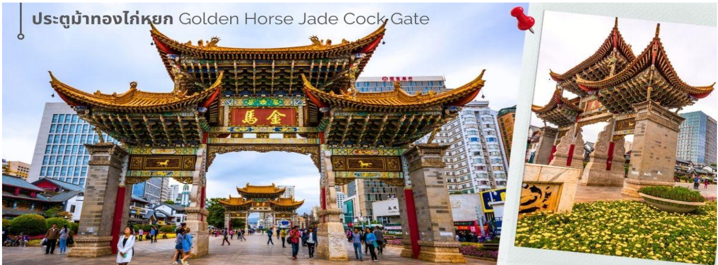
ประตูม้าทองไก่อหยก Golden Horse Jade Cock Gate

เที่ยง 📍 รับประทานอาหารกลางวันที่ภัตตาคาร (14) เมนูพิเศษ สุกี้เห็ดไก่อดำ