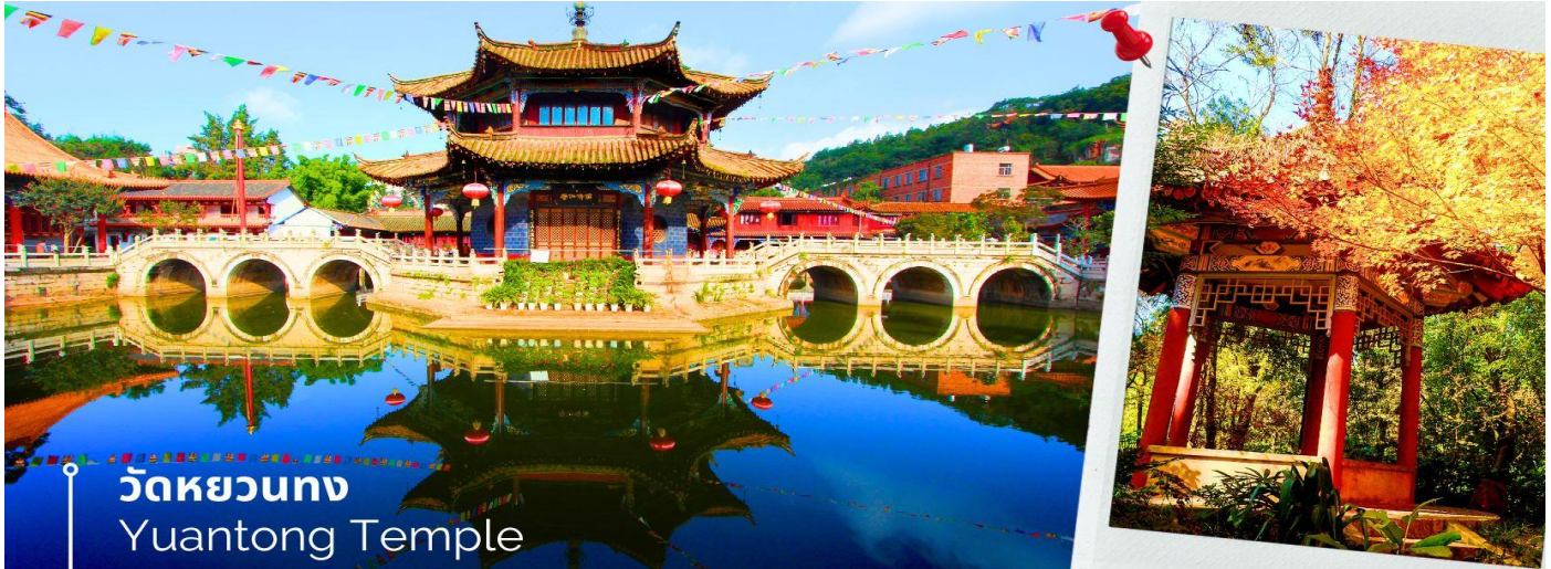
วัดหยวนตง Yuantong Temple

นำท่านชม วัดหยวนตง (Yuantong Temple) วัดแห่งนี้เป็นวัดที่ใหญ่และเก่าแก่ที่สุดในเมืองคุนหมิง สร้างมาตั้งแต่สมัยราชวงศ์ถัง มีอายุยาวนานประมาณ 1,200 กว่าปี การสร้างวัดแห่งนี้จะแปลกตากว่าวัดอื่นในจีน เพราะปกติแล้วการสร้างวัดของจีนส่วนมากจะต้องสร้างอยู่บนภูเขา แต่วัดหยวนตงสร้างวัดต่ำกว่าภูเขา โดยวิหารจะอยู่ต่ำที่สุด เนื่องจากวัดแห่งนี้ไม่ได้สร้างขึ้นเพื่อเป็นวัดโดยตรง แต่เคยเป็นศาลเจ้าแม่กวนอิมมาก่อน