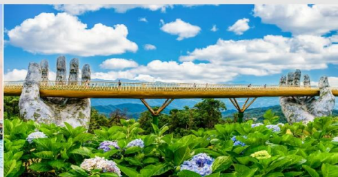
สะพานโกเด็นบริดจ์