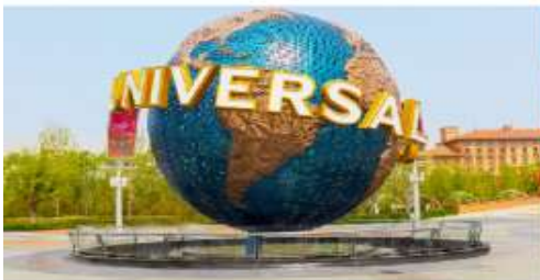
สวนสนุกยูนิเวอร์เซลปักกิ่ง รีสอร์ท