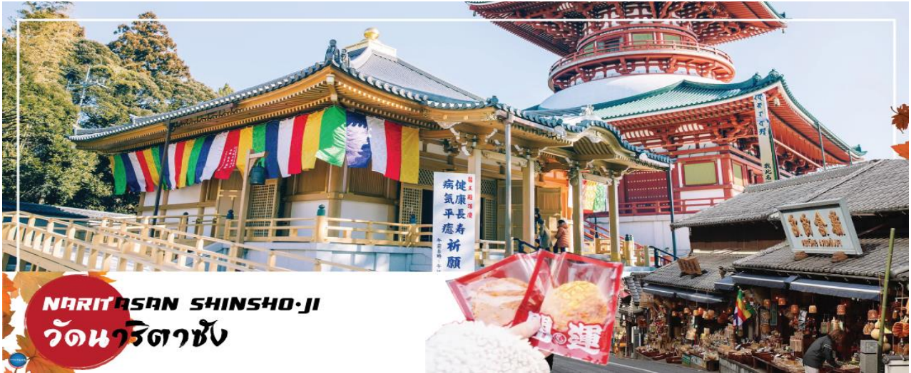
NARITASAN SHINSHO-JI วัดนาริตะชิน

วันที่หก เมืองนาริตะ – วัดนาริตะชิน – ถนนโอมโตะซังโตะ – อีออน มอลล์ – ท่าอากาศยานนานาชาตินาริตะ – ท่าอากาศยานสุวรรณภูมิ