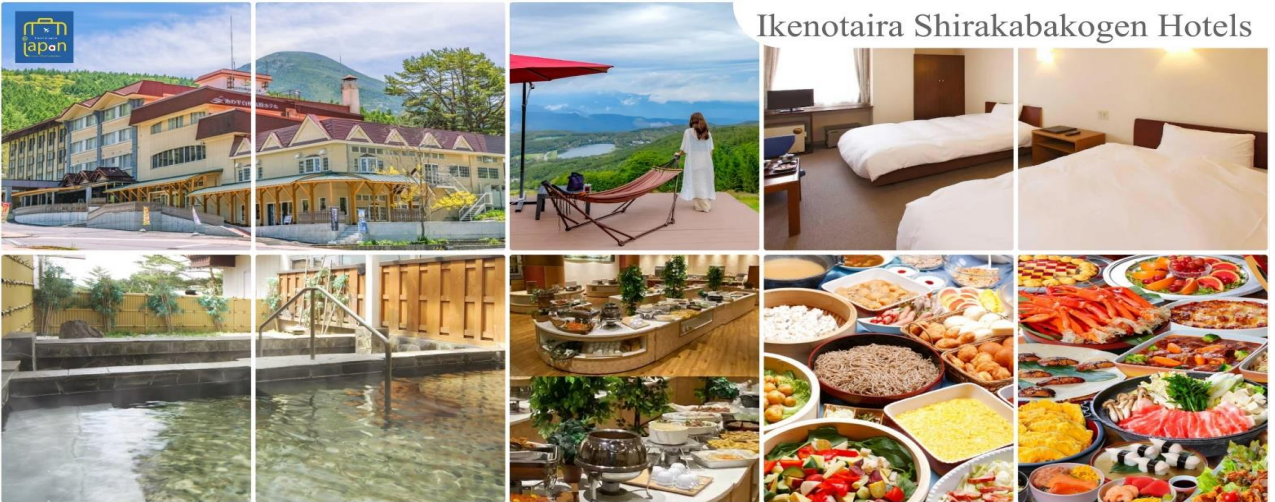
Ikenotaira Shirakabakogen Hotels

หลังอาหารเช้าท่านได้ผ่อนคลายกับการแช่น้ำแร่ธรรมชาติ เชื่อว่าถ้าได้แช่น้ำแร่แล้ว จะทำให้ผิวพรรณสวยงามและช่วยให้ระบบหมุนเวียนโลหิตดีขึ้น