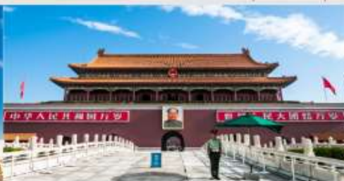
จัดรัสเซียอันเหมิน