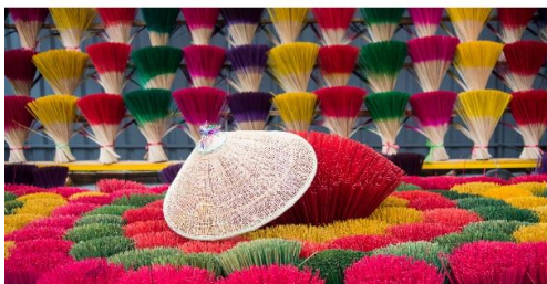
หมู่บ้านรูปหลากสี