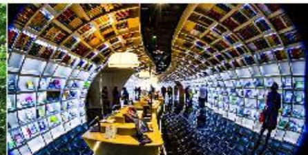
ห้องสมุดกุ้ยโจว

*ทางบริษัทฯ ขอสงวนสิทธิ์ในการสืบโปรแกรมทัวร์ตามความเหมาะสมขึ้นอยู่กับสถานการณ์ปัจจุบัน โดยคำนึงถึงผลประโยชน์ของลูกค้าเป็นสำคัญ