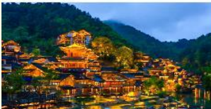
หมู่บ้านวูเจียงจ้าย