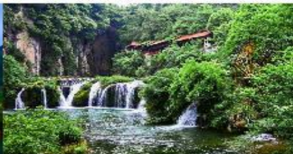
อุทยานเทียนเหอตัน