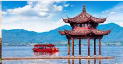
ล่องเรือชมทะเลสาบซีหู