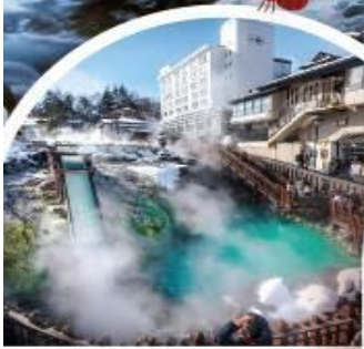
คุซัทสึออนเซ็น