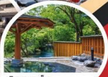
ชิมะ ออนเซ็น

Wifi on bus บริการน้ำดื่ม 10 คน ออกเดินทาง