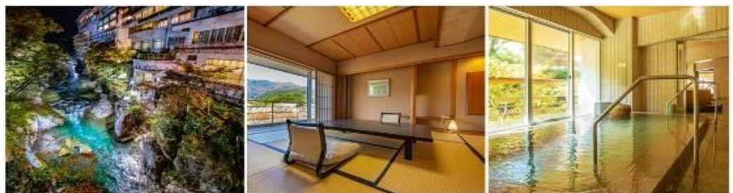
AJ09_4 HAPPINESS BEST ONSEN IN GUNMA 6D4N (SHIMA+KUSATSU+TAKARAGAWA ONSEN) JL