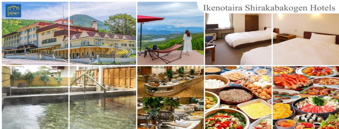
Ikenotaira Shirakabakogen Hotels

รับประทานอาหารค่ำ ณ ภัตตาคาร ของโรงแรม (5) --- บุฟเฟต์นานาชาติ หลังอาหารให้ท่านได้ผ่อนคลายกับการแช่น้ำแร่ธรรมชาติ เชื่อว่าถ้าได้แช่น้ำแร่แล้ว จะทำให้ผิวพรรณสวยงามและช่วยให้ระบบหมุนเวียนโลหิตดีขึ้น