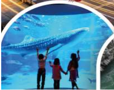
พิพิธภัณฑ์สัตว์น้ำโคยูกัง