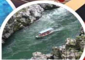
สองเรือใบแม่น้ำช่องเขาโอโตะ