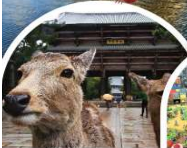
วัตโทโดจิ