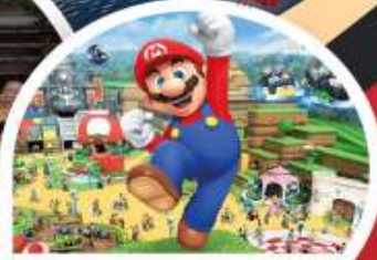
ทิวรี่เสริม Universal Studio