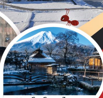
หมู่บ้านโอชิโนะฮักโก