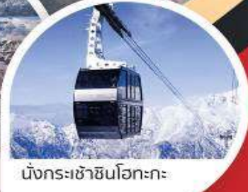
นั่งกระเช้าชินโอะกะ