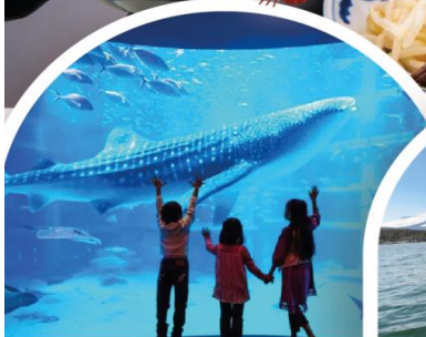
พิพิธภัณฑ์สัตว์โคคุคัง