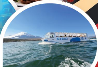
รถบัสสะเท็นน้ำสะเท็นบก

Wifi on bus บริการน้ำดื่ม 10 คน ออกเดินทาง