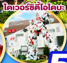
โดเวอร์ซิตี โอดะ