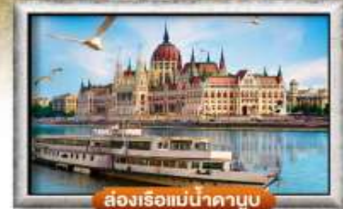
สองเรือแม่น้ำดานูบ

พิเศษ!! ลิ้มลองเมนูประจำชาติ ทั้ง 5 ประเทศ!!!