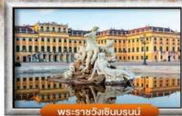
พระราชวังเซินบรุนน์