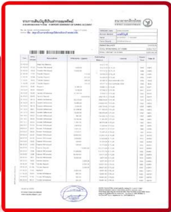
ตัวอย่าง Bank Statement ที่ผู้สมัครต้องขอจากธนาคาร

3.3 ปรับสมุดบัญชีธนาคารตัวจริง และเตรียมไปในวันที่ยื่นวีซ่า