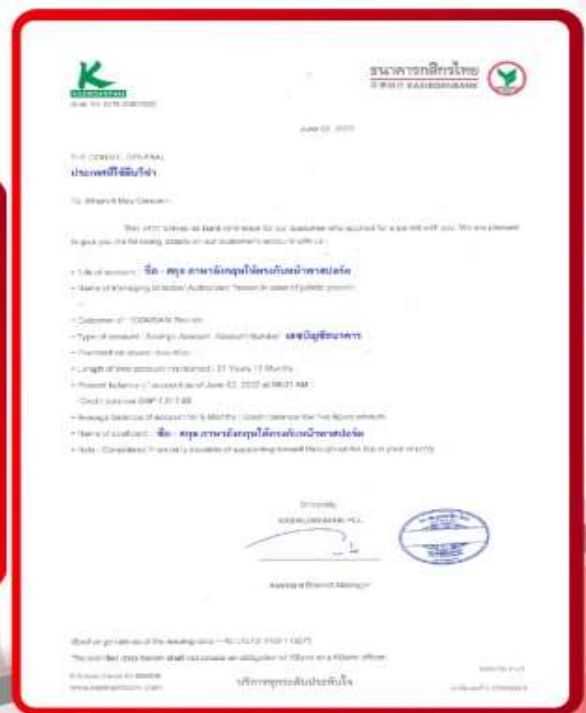
ตัวอย่าง Bank Guarantee ที่ผู้สมัครต้องขอจากธนาคาร