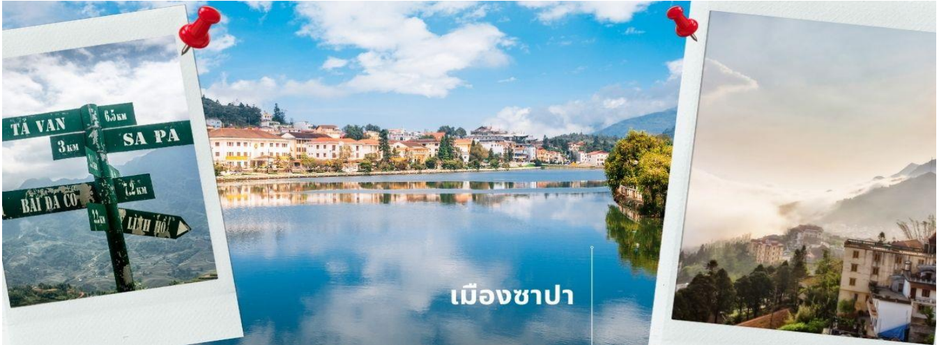
เมืองซาปา

14.20 น. เดินทางถึง สนามบินसानอย หลังผ่านการตรวจคนเข้าเมืองและศุลกากรแล้วนำท่านขึ้นรถบัสปรับอากาศ นำท่านเดินทางขึ้นเหนือมุ่งหน้าสู่ เมืองซาปา ซึ่งตั้งอยู่ทางภาคเหนือของประเทศเวียดนามใกล้กับชายแดนจีน อยู่ในเขตจังหวัดลาวไก ตัวเมืองตั้งอยู่บนระดับความสูงกว่าระดับน้ำทะเลถึง 1,650 เมตร จึงมีอากาศหนาวเย็นตลอดปี ที่นี่จึงเป็นแหล่งปลูกผักและผลไม้เมืองหนาวที่สำคัญของเวียดนาม อีกทั้งยังเป็นดินแดน