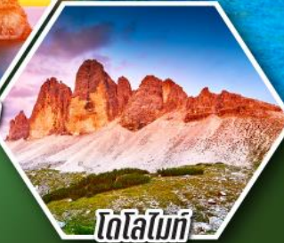
โตโลไมท์