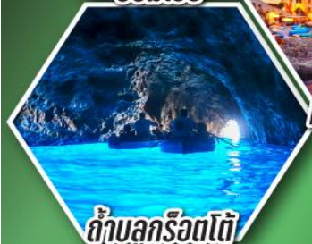
ถ้ำลูกรोटโต้