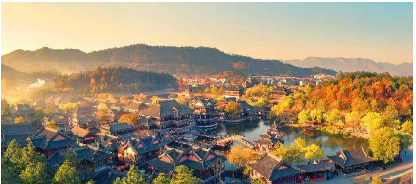
GO1HGH-CA003 หังโจว เหวงเตี้ยน หวงหลิง หุบเขาเทวดาวังเซียนถู่ 6วัน 4คืน โดยสายการบิน AIR CHINA (CA)

จากนั้นนำท่านชม โรงถ่ายภาพยนตร์ชื่อดัง HENGDIAN WORLD STUDIOS โรงถ่ายภาพยนตร์และละครโทรทัศน์จีนที่ใหญ่ที่สุดในโลก สร้างขึ้นในปี ค.ศ. 1996 มีพื้นที่กว่า 3,300 เฮกเตอร์ หรือประมาณ 13,000 ไร่ ที่จำลองเอาบ้านเมืองในยุคสมัยทางประวัติศาสตร์ต่างๆ ทั้งพระราชวังหมู่บ้านตามยุคสมัยมารวมไว้ในสถานที่เดียว ประกอบด้วยฉากจำลองต่างๆ กว่า 700 ฉาก และยังมีฉากด้วยสเกลเทียบเท่าของจริงอีกด้วย ในปัจจุบันมีผู้เข้าชมสตูดิโอแห่งนี้กว่า 10 ล้านคนต่อปี เป็นแหล่งท่องเที่ยวระดับ 5A ของจีนที่ได้รับความนิยมอย่างมากของชาวจีนและชาวต่างชาติที่ต้องลองไปเยือนสักครั้ง นำท่านชม พระราชวังกู้กงหมิงซิงจำลอง ในโรงถ่ายภาพยนตร์เหิงเตี้ยน ภายในจำลองพระราชวังกู้กง ในอัตราส่วน 1:1 เพื่อการถ่ายทำในส่วนของพระราชวังโบราณ และนำท่านชม พระราชวังจำลองจิ้นซีฮ่งเต้