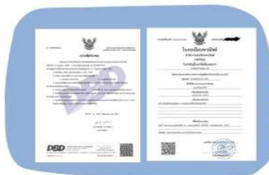
ตัวอย่างหนังสือจดทะเบียนบริษัท และ ใบทะเบียนพาณิชย์