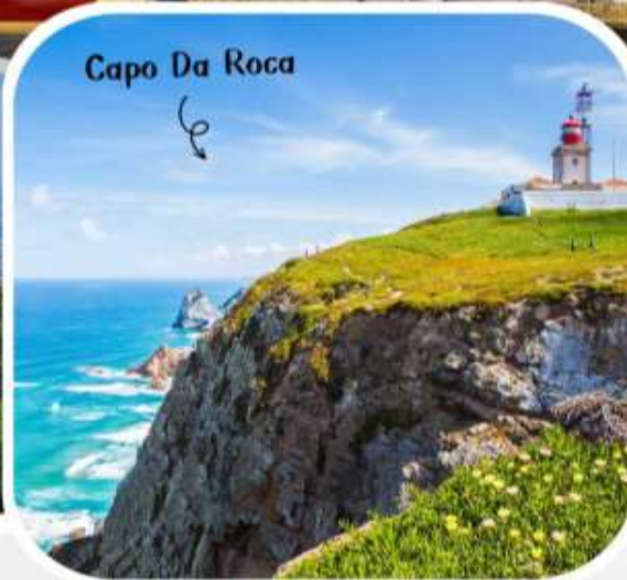
Capo Da Roca