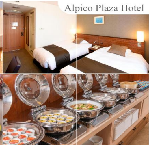
Alpico Plaza Hotel