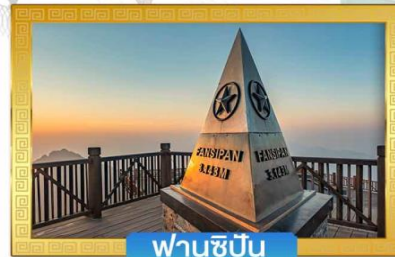
ฟานซีปัน