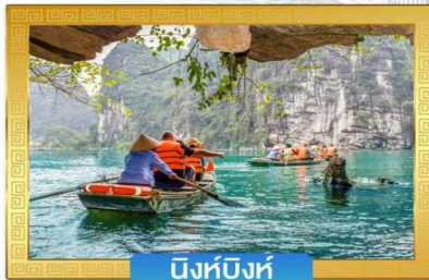
นิงห์บิงห์