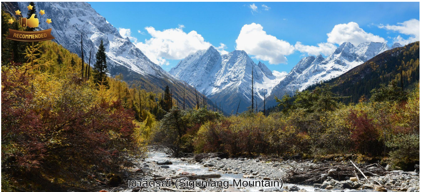
เขาซีดรูณี (Siguniang Mountain)

นำท่านเดินทางประมาณ 3 ชั่วโมงสู่ ภูเขาซีดรูณี หรือชื่อเรียกเป็นภาษาจีนว่า ซ็อกูเหนียงซาน (รวมรถอุทยาน) ตั้งอยู่ในอุทยานฉางผิง เขตปกครองตนเองอาปั๋ว มณฑลเสฉวน ทางตะวันตกเฉียงใต้ของจีน มีเนื้อที่กว่า 2,000 ตารางกิโลเมตร ปัจจุบันได้รับการขึ้นทะเบียนเป็นอุทยานแห่งชาติระดับ 5A และที่ได้รับความนิยมว่า เทือกเขาแอลป์ในแผ่นดินจีน เพราะมีลักษณะยิ่งใหญ่และสูงชัน คล้ายเทือกเขาแอลป์ในยุโรปตอนใต้ เป็นภูเขาที่ตั้งเรียงรายต่อกัน 4 ลูก บนที่ราบสูงจากทิศเหนือถึงทิศใต้ เป็นระยะทาง 3.5 กิโลเมตร ตั้งอยู่ระหว่างธารน้ำใสฉางผิงโกวกับไห่จื่อโกว โดยมีความสูงเหนือระดับน้ำทะเลคือ 6,250 / 5,664 / 5,454 และ 5,355 เมตร และมีหิมะปกคลุมตลอดทั้งปี เหมือนสิริระที่คลุมด้วยผ้าสีขาวของหญิงสาว 4 คน ประกอบด้วยยอดเขา 4 ลูก เรียงกันบนพื้นที่ราบสูง ประกอบด้วย ต้ากูเหนียงเฟิง แปลว่า พี่สาวคนโต, เอ้อกูเหนียงเฟิง แปลว่า พี่สาวคนรอง, ซานกูเหนียงเฟิง แปลว่า พี่สาวคนกลาง, เหยาเหนียงเฟิง แปลว่า น้องสาวคนสุดท้อง ตามตำนานเล่าว่าเป็นยอดเขาที่สูงที่สุดคือน้องสาวคนสุดท้องเพราะตามธรรมเนียมท้องถื่นน้องจะมีความเป็นอยู่สบายที่สุด ร่างกายจึงเจริญเติบโตได้ดีที่สุด ส่วนพี่นั้นต้องทำงานช่วยพ่อแม่ เลี้ยงน้อง ร่างกายจึงเจริญเติบโตได้ไม่เต็มที่ ทำให้กลายเป็นภูเขาที่มีขนาดเล็กที่สุดนั่นเอง