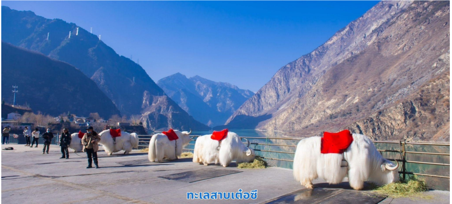
ทะเลสาบเต๋อซี

นำท่านเดินทางผ่านชม เมืองโบราณซงพาน เมืองซงพานเคยเป็นเมืองการค้าแหล่งซื้อขายแลกเปลี่ยนสินค้าตามแนวชายแดนและป้อมปราการทางภาคตะวันตกเฉียงเหนือ มีอายุเก่าแก่กว่า 500 ปี ถือเป็นเขตแดนรอยต่อและตลาดชายแดนระหว่างชาวฮั่นและชาวทิเบตในอดีต ซึ่งชาวฮั่นจะนำสินค้าจำพวกใบชา ข้าวสารและผ้าทอ ไปแลกเปลี่ยนกับสินค้าจำพวกม้า วัวหนังและขนสัตว์ที่มาจากทิเบต ผ่านชมซุ้มประตูและแนวกำแพงเมืองที่สร้างในสมัยราชวงศ์หมิง จากนั้นนำท่านเดินทางสู่ เมืองจิวจี้โกว เป็นพื้นที่อนุรักษ์ธรรมชาติทางตอนเหนือของมณฑลเสฉวน ตั้งอยู่ทางตอนใต้สุดของเทือกเขาหิมาลัย ห่างจากเมืองเฉิงตูไปทางเหนือ 330 กิโลเมตร เป็นสถานที่ท่องเที่ยวทางธรรมชาติมีชื่อเสียงจากน้ำตกหลายระดับชั้นและทะเลสาบที่มีสีสันงดงาม สามารถท่องเที่ยวได้ทุกฤดูกาล ซึ่งจะได้เห็นความสวยงามของที่แห่งนี้แตกต่างกันไปตามช่วงเวลา และได้รับการประกาศให้เป็นมรดกโลกเมื่อปี พ.ศ. 2535