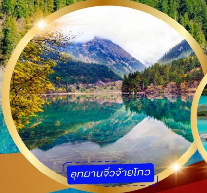
อุทยานจิวโจโกว