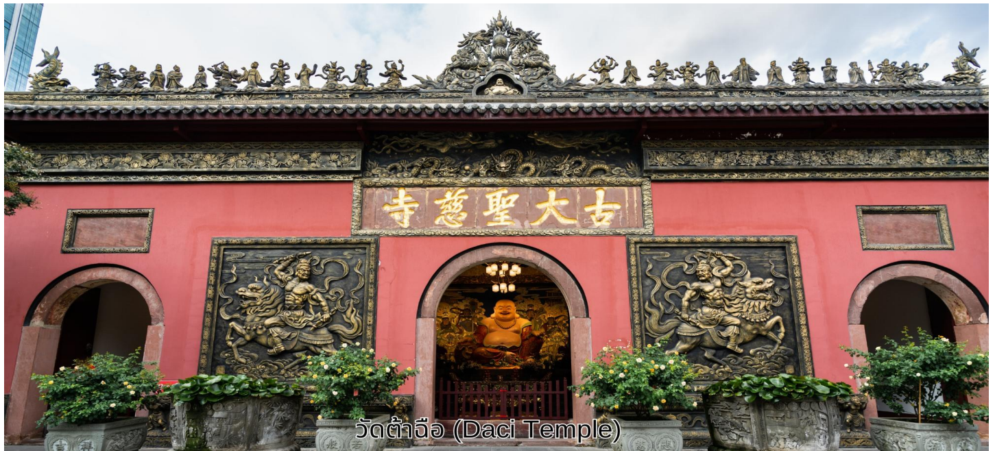
วัดต้าจื่อ (Daci Temple)

เช้า บริการอาหารเช้า ณ ห้องอาหารของโรงแรม จากนั้นเดินทางไปยัง วัดต้าจื่อ เป็นวัดเก่าแก่ที่มีอายุยาวนานกว่า 1,600 ปี ตั้งอยู่ใจกลางของ Chengdu ที่นี่ถือเป็นสถานที่สำคัญที่น่าสนใจ เพราะเป็นวัดที่พระถังซำจั๋งบวชเป็นพระภิกษุก่อนจะย้ายไปจำพรรษายังวัดอื่นภายในวัดต้าจื่ออันเงียบสงบ