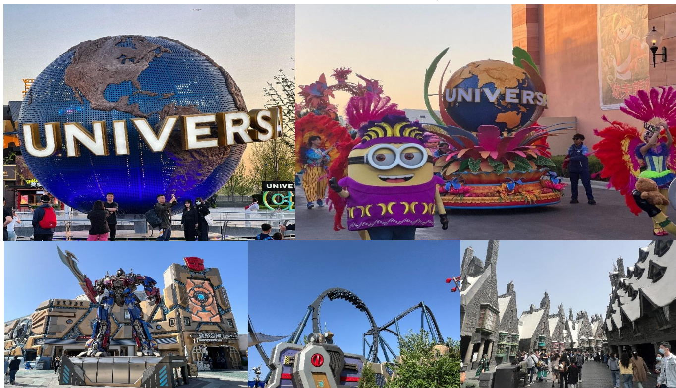
GO1CNXPEK-CA007 เชียงใหม่ เที่ยวบิน 2 สวนสนุก มหานครปักกิ่ง Universal Studio + Pop Land 5 วัน 3 คืน 5 วัน 3 คืน (CA) ไม่ลงร้าน