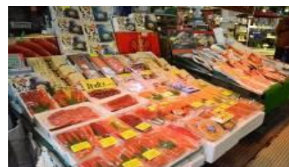
ตลาดปลาโกโจ