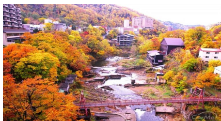
โจซังเคชมใบไม้เปลี่ยนสี