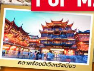
ตลาดร้อยปีฉางหวิงเมียว