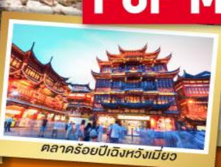
ตลาดร้อยปีเมืองหวังเมี่ยว