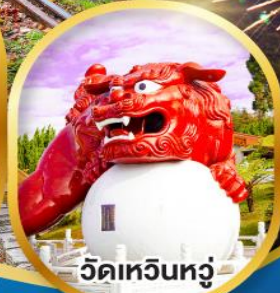
วัดเหวินหัว