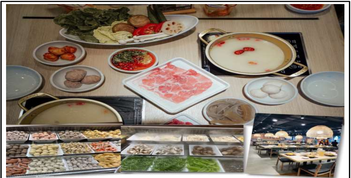
เทียง รับประทานอาหารเทียง ณ ภัตตาคารไอ (5) เมนูชาบู