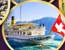
ส่องเรือ ทะเลสาบเจนีวา