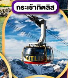
กระเช้าทิตลิส