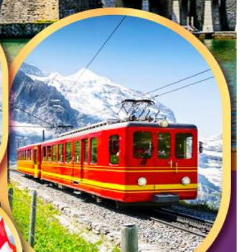
รถไฟสู่ ยอดเขาจุงเฟรา