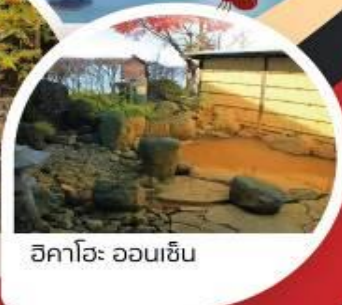
อิคาโฮะ ออนเซ็น