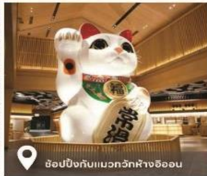
ช้อปปิ้งกับแมวทักฮังจ้ออน