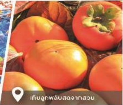
เก็บลูกพลับสดจากสวน