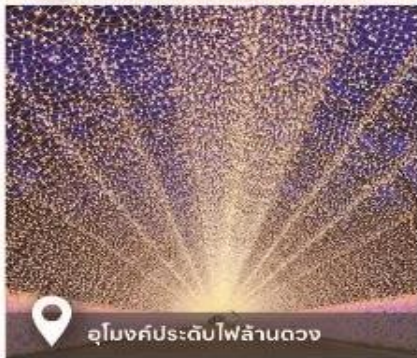
อุโมงค์ประดับไฟล้านดวง