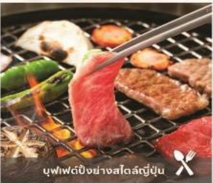
บุฟเฟ่ต์ปิ้งย่างสไตล์ญี่ปุ่น