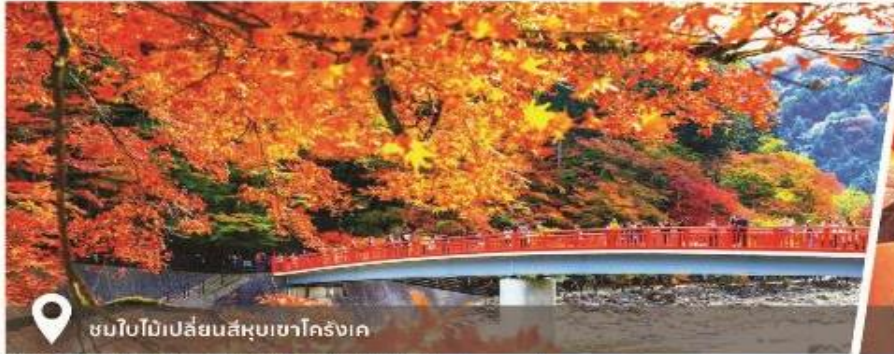
ชมใบไม้เปลี่ยนสีหุบเขาโคริงเค