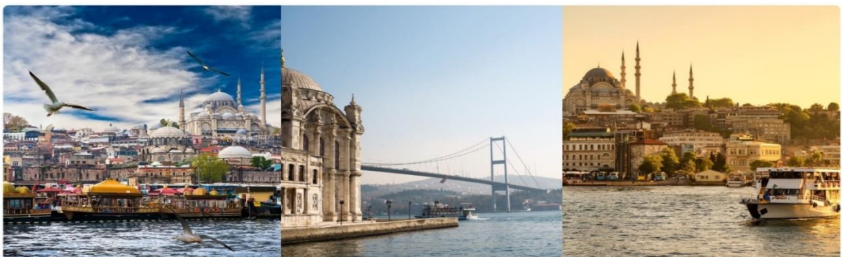
หน้า 13 (ภาพใช้เพื่อการโฆษณาเท่านั้น)

นำทุกท่าน ล่องเรือช่องแคบบอสฟอรัส จุดที่บรรจบกันของทวีปยุโรปและเอเชีย ซึ่งทำให้ประเทศตุรกีได้รับสมญานามว่า ดินแดนแห่งสองทวีป ช่องแคบบอสฟอรัสยังเป็นจุดยุทธศาสตร์สำคัญ เนื่องจากเป็นเส้นทางเดินเรือที่เชื่อมทะเลดำทะเลมาร์มาร่า เราจะได้เห็นป้อมปืนที่ตั้งเรียงรายอยู่ตามช่องแคบได้แก่ Rumeli Castle และ Anatolia Castle โดยจุดชมวิวที่สำคัญคือสะพานแขวนบอสฟอรัส เชื่อให้รถยนต์สามารถวิ่งข้ามฝั่งยุโรปและเอเชียได้ สร้างเสร็จในปี ค.ศ.1973 มีความยาวทั้งสิ้น 1,560