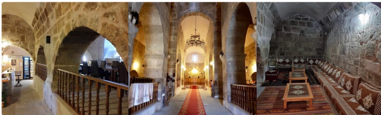
หน้า 6 (ภาพใช้เพื่อการโฆษณาเท่านั้น)

จากนั้น เดินทางสู่ เมืองปามุคคาเล่ เมืองที่มีน้ำพุเกลือแร่ร้อนไหลทะลุขึ้นมาจากใต้ดินผ่านซากปรักหักพังของเมืองเก่าแก่สมัยกรีกก่อนที่ไหลลงสู่หน้าผา ใช้เวลาเดินทาง 3 ชม.(189 กม.)ระหว่างทางแวะถ่ายรูป CARAVANSARAI ที่พักของกองคาราวานในสมัยโบราณ เป็นสถานที่พักแรมของกองคาราวานตามเส้นทางสายไหมและชาวเติร์ก สมัยออตโตมัน