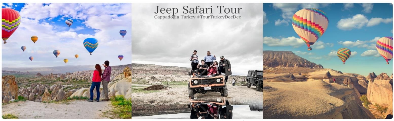
หน้า ๓ (ภาพใช้เพื่อการโฆษณาเท่านั้น)

05.30 น. นำท่านออกเดินทาง (Jeep Safari) เพื่อชมความงดงามของเมืองคัปปาโดเกียในอีกมุมหนึ่งที่หาชมได้ยาก ใช้เวลาอยู่บนรถจี๊ปบริเวณภาคพื้นดินในบริเวณที่รถเล็กสามารถทะลุไปได้ประมาณ 45 นาที ถึง 1 ชั่วโมง