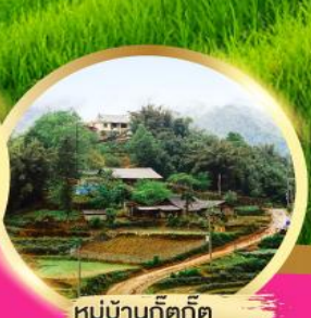
หมู่บ้านกัตกัต